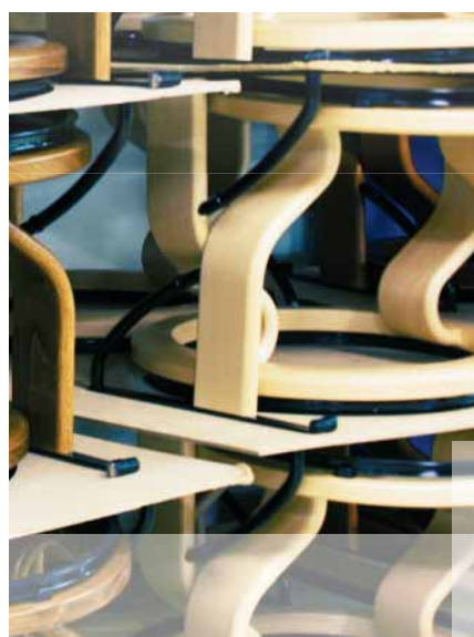
■ Almacenamiento de las bases de madera ante su montaje