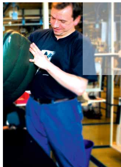
■ Fase de revestimiento de los asientos