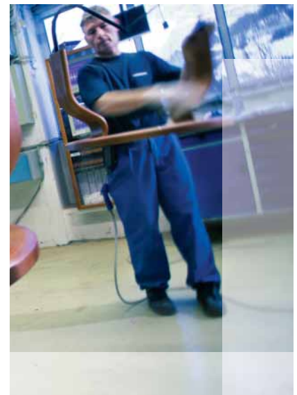
■ Barnizado de las bases