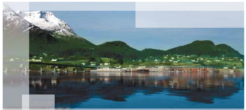
■ Todos nuestros modelos están producidos en fábricas situadas únicamente en Noruega. (Ilustración: Fábrica de Sykkylven)