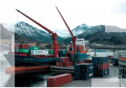
■ Cargamento de los productos terminados en barcos

Ekornes otorga una gran importancia al entorno interno de sus instalaciones. Cuando se hacen inversiones y cambios, siempre se tiene muy en cuenta la salud y la seguridad de los trabajadores. Un importante porcentaje de nuestras inversiones anuales (que suman alrededor de 100 millones de coronas noruegas al año o sea cerca de 12,5 millones de Euros al año) se dedican a la prevención de riesgos de salud o accidentes. Esto es algo que se consigue también mediante la vigilancia cotidiana de las áreas de riesgo y a través de procedimientos y reglamentos internos. Además, la legislación noruega estipula unas estrictas exigencias mínimas con las que la empresa debe cumplir. La organización de salud, seguridad y medio ambiente de la empresa constituye una parte integral de su gestión operativa.